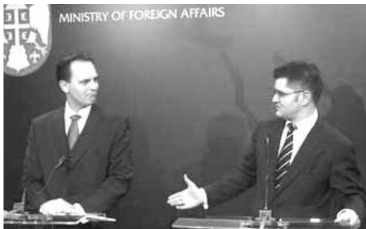
Ο κ. Δ.Δρούτσας με τον Σέρβο υπουργό Εξωτερικών Β.Γέρεμιτς

Ερωτηθείς ειδικότερα για την πορεία των διαπραγματεύσεων με την ΠΓΔΜ, ενό-